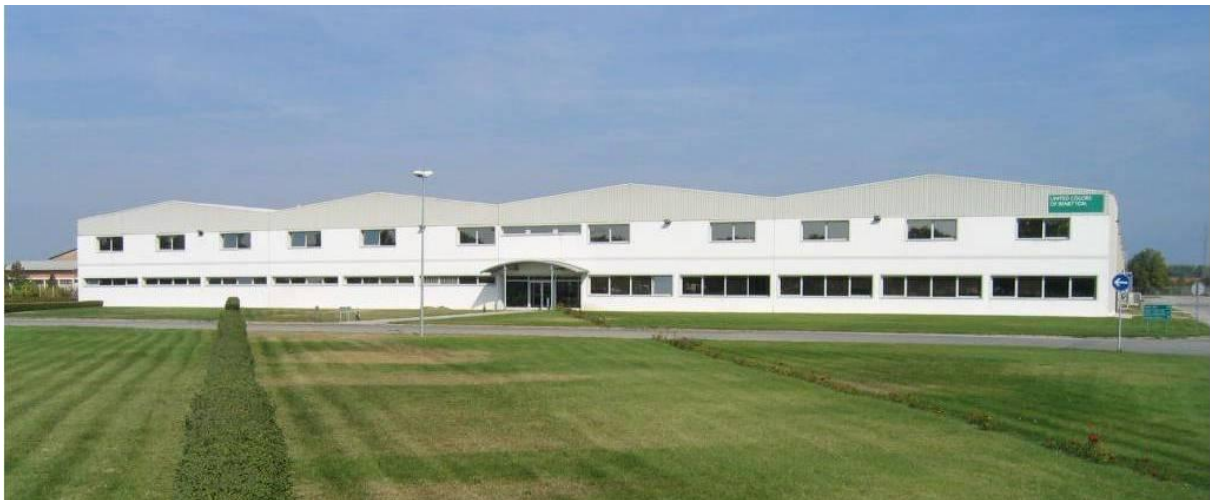
Slika 1: Tvornica u Osijeku, slika iz snimke

Prije projekta, tvornica je koristila postrojenje za pročišćavanje vode izgrađeno prije više od 10 godina, koje se sastojalo od biološkog postrojenja sa klasičnim završnim pročišćivačem, osmišljen za pročišćavanje otpadne vode iz tekstilnog sustava i izbacivanje iste u kanalizaciju.