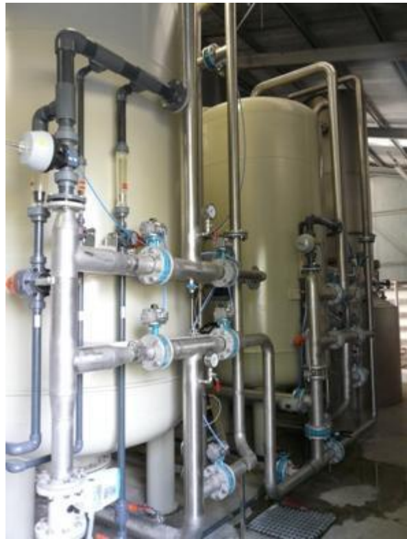
Slika 2: Filter sa smolom