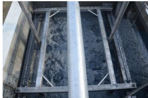
Slike 3 i 4: MBR modul u startnoj fazi i tijekom radne faze

Svi sustavi uključeni u Wasatex projekt rade automatski i kontroliraju ih PLC (Programmable Logic Controller), čak i izdaleka, što omogućuje trenutno viđenje bilo kojeg zaštitnog alarma i optimiziranje operativnih parametara.