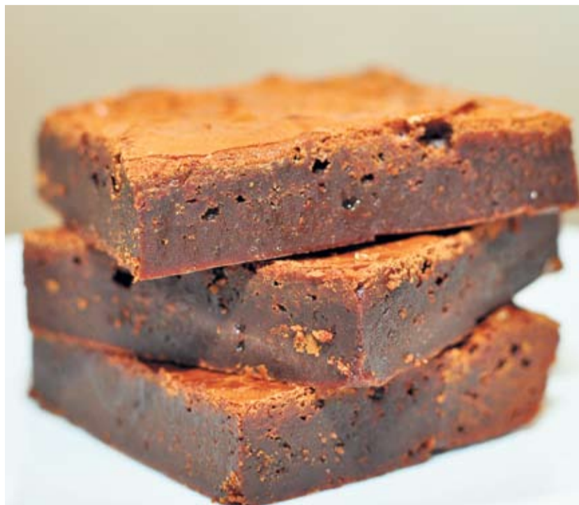
Torte i kolači su od kvalitetnih namirnica, uvijek svježi i uvijek isti jer je najvažnije održati kvalitetu i opravdati povjerenje kupaca i gostiju