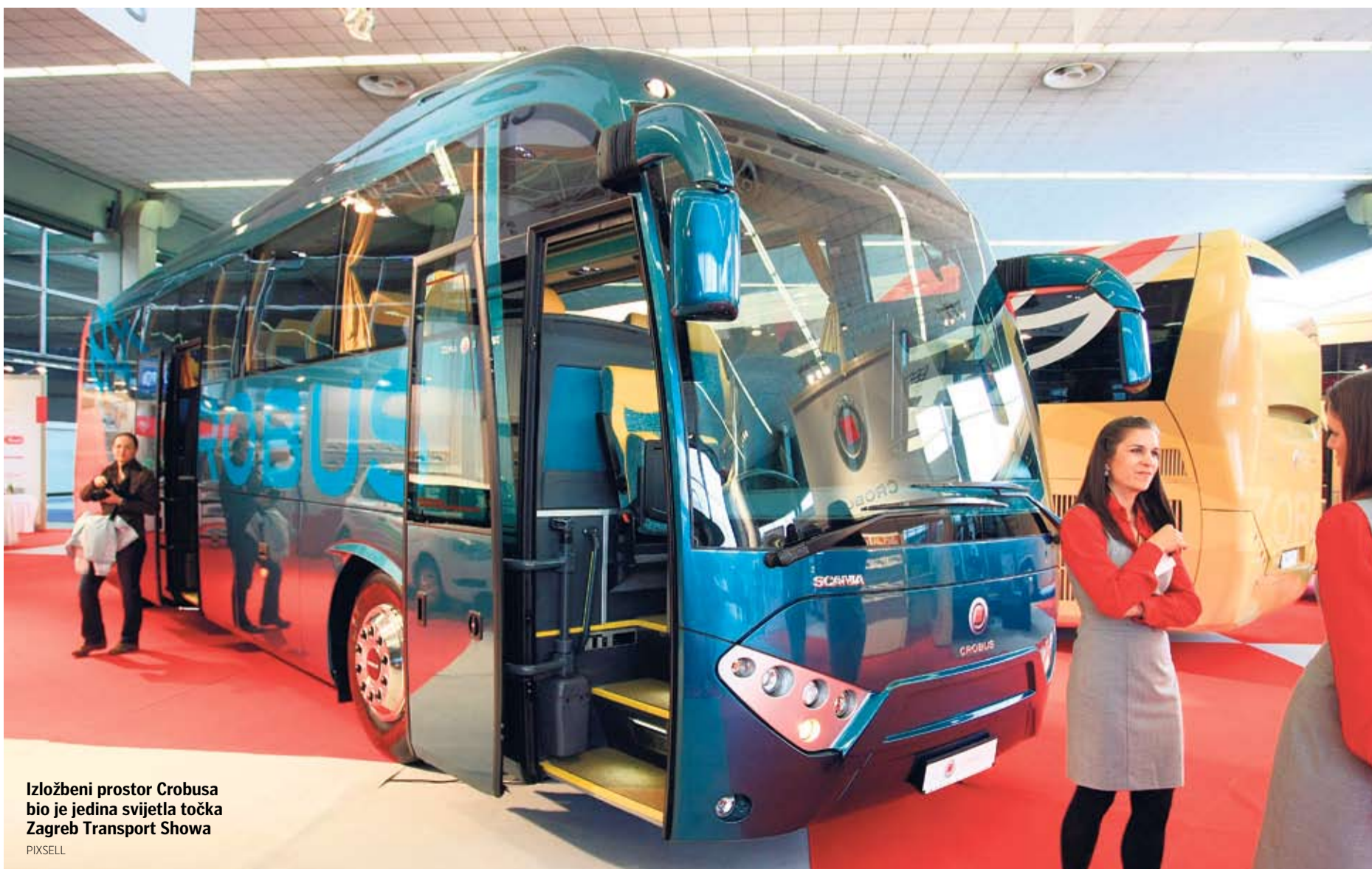
Izložbeni prostor Crobusa bio je jedina svijetla točka Zagreb Transport Showa