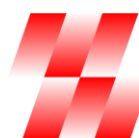
ZEPSR Association of Electrotechnical Industry of the Slovak Republic