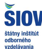
ŠIOV Štátny inštitút odborného vzdelávania